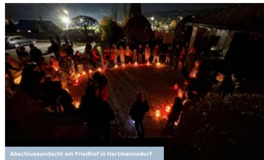
Abschlussandacht am Friedhof in Hartmannsdorf