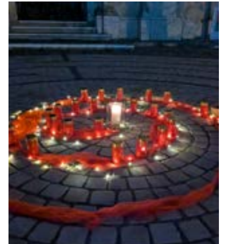
Lichterlabyrinth in Gleisdorf

waren dann am 2. November in Gleisdorf Kinder samt ihren Familien eingeladen. Auch heuer zogen sie mit Lichtern zum Friedhof, begleitet von einer berührenden Geschichte über den roten Faden des Lebens — Sinnbild für Gottes Nähe, die Verbindung von Himmel und Erde und das bleibende Band der Liebe zu unseren Verstorbenen. Ein herzlicher Dank an alle, die der Einladung gefolgt sind und die Feier mitgestaltet haben.