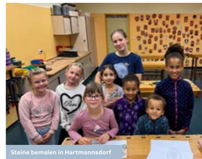
Steine bemalen in Hartmannsdorf