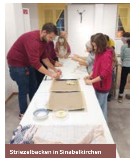
Striezelbacken in Sinabelkirchen