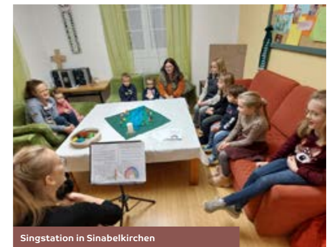
Singstation in Sinabelkirchen