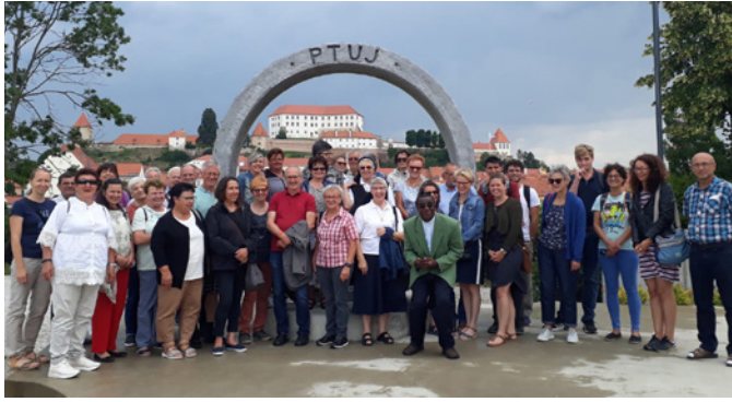
Ein Programmpunkt war eine Führung durch die schöne, an der Drau liegende Stadt, Ptuj.

Nach einer Pause fand heuer wieder der traditionelle Mitarbeiter*innenausflug am Freitag nach Fronleichnam statt. Dieses Mal führte die Reise in unser Nachbarland Slowenien zur Wallfahrtskirche Ptujška Gora und in die Stadt Ptuj. Als Dankeschön